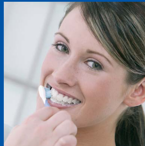
Wird die beginnende Parodontitis nicht gestoppt, droht Zahnausfall. So weit muss es nicht kommen.